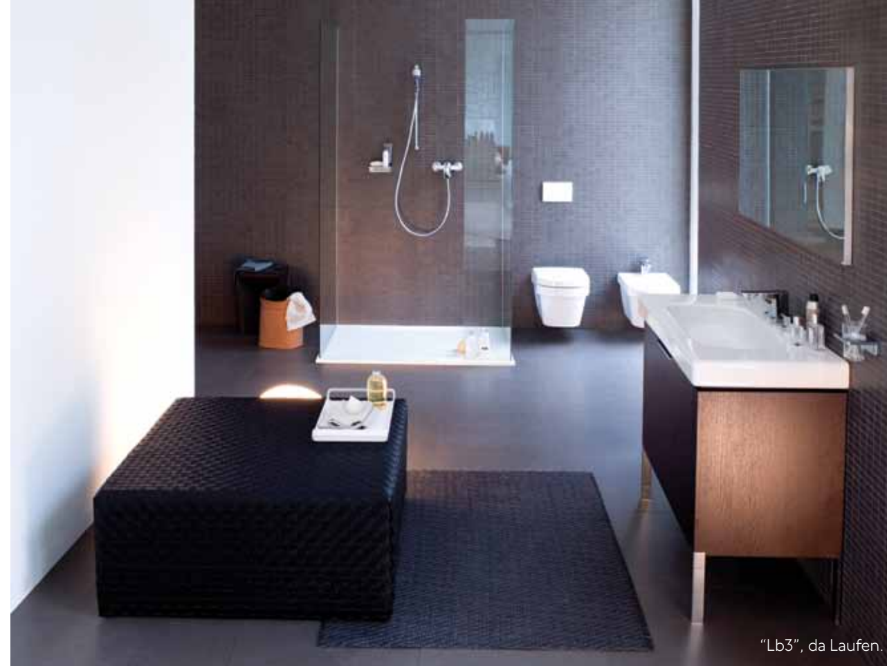
"Lb3", da Laufen.

Quanto à importância da feira, os números são claros: 10 mil novos produtos apresentados, 2500 expositores e uma ocupação de área de exposição de 209 mil m 2 . A principal nota que registámos, foi um claro regresso à simplicidade e sobriedade no segmento do mobiliário. O piscar de olho aos mercados russo e chinês foi posto de lado. Marcas como a Kartell ou a Moroso, por exemplo, regressaram a um apelo clássico, numa estética claramente europeia e menos fantasista. Nos expositores percebemos uma mudança radical de acolhimento, onde foi notória uma atitude privilegiada para os negócios e uma menor exuberância comunicativa para com a imprensa. Percebemos que os