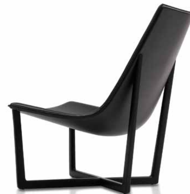
"Jade", Christophe Pillet para a Porro.

Uma nota final para referir que os promotores do Salão Internacional do Móvel e uma grande generalidade de marcas de design começaram a adjudicar uma considerável parte dos seus orçamentos de comunicação, num patamar máximo na ordem dos 10%, nomeadamente publicidade e vendas de catálogo, por via das novas plataformas digitais como o Facebook ou o Google. www.cosmit.it