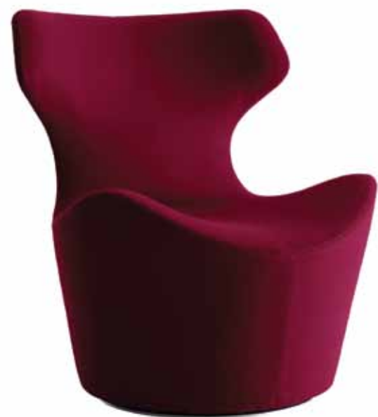
"Piccola Papilio", Naoto Fukasawa para a B&B Italia.